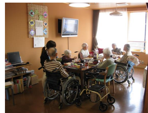
リビング(各ユニット)