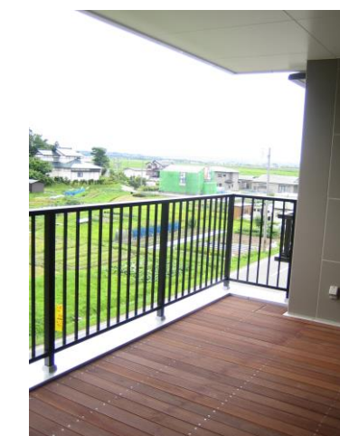
テラス(各ユニット)